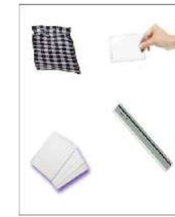
Εικόνα 6: Φύλλο Αξιολόγησης

«Και τώρα τα ποντικάκια τι πρέπει να κάνουν; Το καθρεπτάκι είναι πολύ βαρύ και δεν μπορούν να το μετακινήσουν. Το μόνο που μπορούν να κάνουν είναι να βάλουν μπροστά από τον καθρέπτη κάποιο άλλο αντικείμενο που δεν θα μπορεί να στείλει το φως προς την είσοδο της πονतिकότρυπας. Αλλά δεν ξέρουν ποιο! Θέλετε να βοηθήσουμε τα ποντικάκια να βρουν ποια αντικείμενα δεν μπορούν να στείλουν το φως προς τα εκεί;». Αφού παρουσιάσουμε στα παιδιά τα υλικά, τα ρωτάμε ποια νομίζουν ότι μπορεί να μην στέλνουν το φως σε άλλη κατεύθυνση από αυτή που φωτίζει η λάμπα. Αφού κάνουν υποθέσεις, τους δίνουμε τα υλικά να τα χειριστούν με παρόμοιο τρόπο όπως το καθρεπτάκι, για να ανακαλύψουν ποια υλικά ανακλούν και ποια δεν ανακλούν το φως.