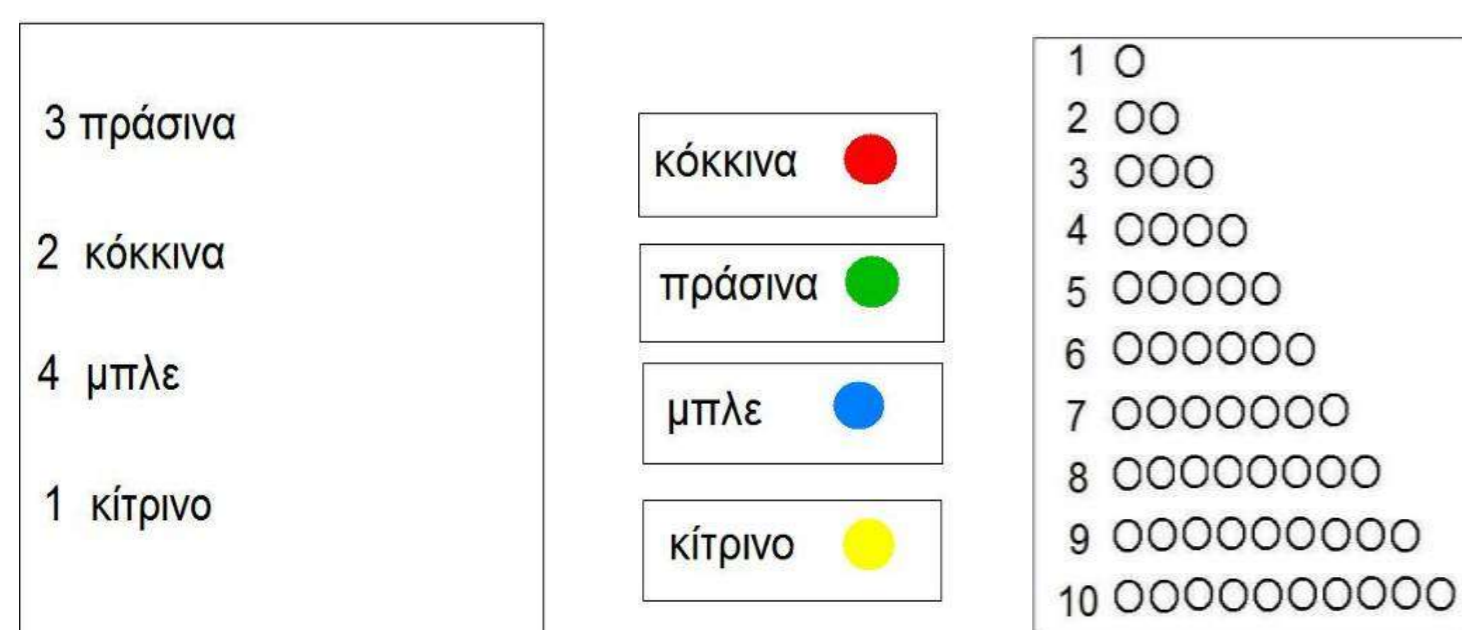
Εικόνες 1, 2, 3, 4: Ένα χαρτόνι-λίστα, 4 καρτέλες, ένας πίνακας αναφοράς, χάρτινα ποντικονομίσματα.

«Για να δουν τα ποντικάκια να ποιο είναι αυτό το αντικείμενο, πρέπει να χρησιμοποιήσουν ένα ζευγάρι κιάλια για να μπορούν να δουν μακριά. Όμως τα κιάλια στο Ποντικοχωριό, λειτουργούν μόνο με ποντικονομίσματα!». Τα παιδιά καλούνται να συλλέξουν τον σωστό αριθμό ποντικονομισμάτων που χρειάζονται τα κιάλια.